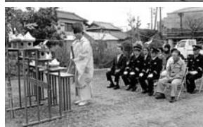
↑生涯学習館北側には第2分団の屯所を建設中です。起工式の様子