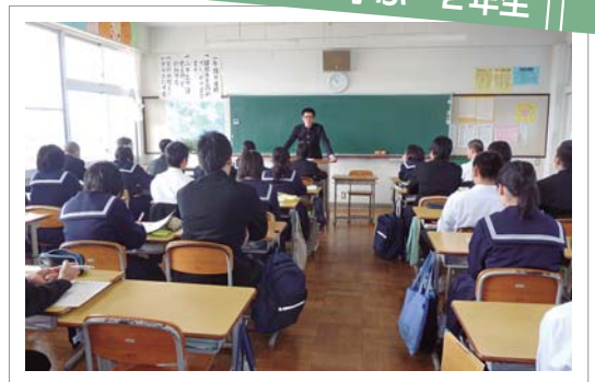
(本校卒業生に来てもらい高校について話を聞きました)

現役の高校生にきてもらってとてもよかった。何かというと高校ってけっこう難しい上下関係があったり、勉強の内容が急に難しくなって、分からなくなるんじゃないかという疑問に対して「心配ない」「1年しっかりやれば入れる」と言っていて少し安心しました。おまけに部活動は中学と比べられないくらいしんどいということも分かり入りたくなった。でも、中学の部活は大事ということが分かりしっかりやろうと思った。(男子)