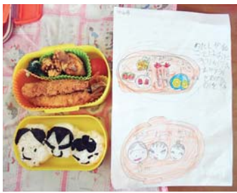
↑ 事前に作りたいお弁当を 絵に描きました うまくできたかな? ↓

今年度のマイ弁当の日は、6月10日(月)、10月10日(木)、1月10日(金)です。子どもたちにとって楽しく、食体験を増やしていくきっかけにしてほしいです。