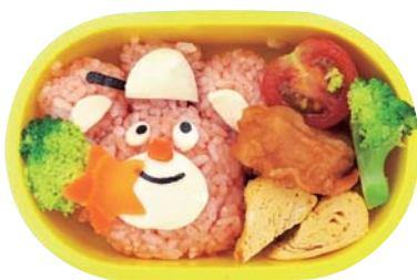
←保育所のお弁当の日です メニューをリクエスト したり、できることから スタートします