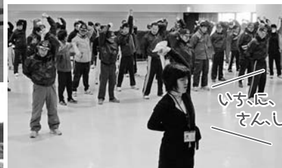
いっしょに さんし