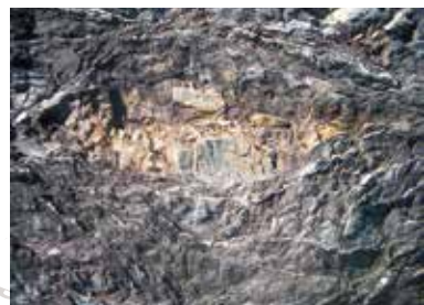
③ メランジュの様子 取り込まれた砂岩が引きちぎられている。