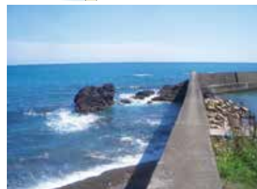
⑥ 枕状溶岩 1億3000万年前ハワイ周辺の海底で噴出した溶岩。6000万年かけて3000kmを移動(年間5cm移動してきた)