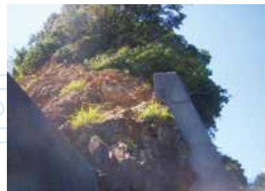
① 西分漁港西側地層 1億5000万年前:砂岩、泥岩(タービタイト)