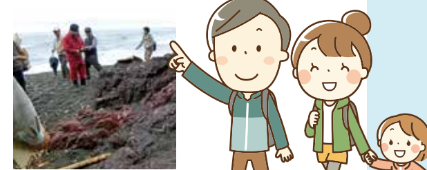
⑦ 赤い石灰岩 枕状溶岩に赤い石灰岩が挟まっている状態。9000万年～4000万年前に堆積したナノプランクトンで出来ている4000m程度の海底火山の噴火の枕状溶岩の間に堆積してできた。