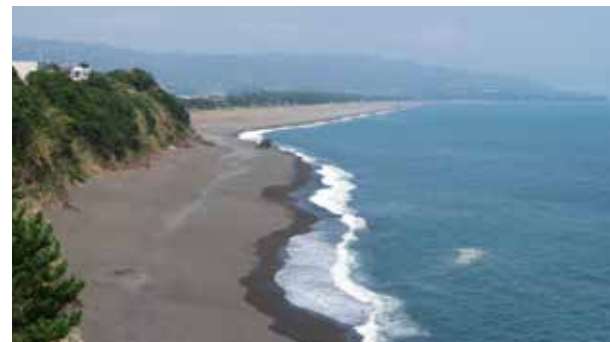
⑧ ビュースポット ビュースポットから見た琴ヶ浜方面