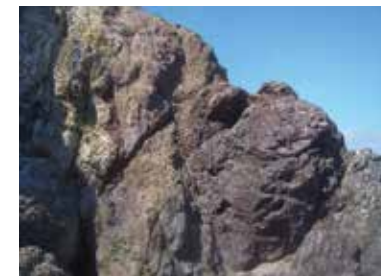
⑤ メランジュ構造の岩塊 1億3000万年前の枕状溶岩と赤色チャート、8500万年前の多色凝灰岩が混り合っている状態が露出している。