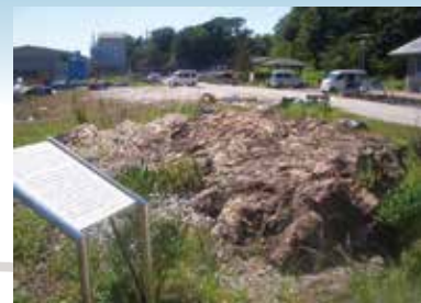
④ チャート岩塊 動物プランクトン放散虫が堆積して出来た、1億3000万年前の岩石。