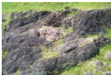
② 砂岩・泥岩のメランジュ 泥岩の中に砂岩が取り込まれている。 7500万年～7000万年前の地層。