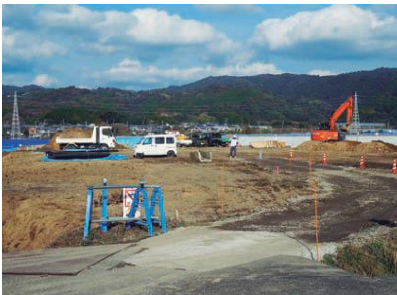
村営住宅造成工事

732万円を追加し総額を38億8804万円とするもの。 芸西米ブランド確立支援事業補助金732万円。