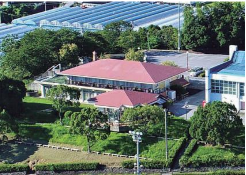
管理を委託する村の家

指定期間 令和2年4月1日から令和3年3月31日。 ただし、再延長は1年を単位として令和7年まで。 【全員賛成で可決】