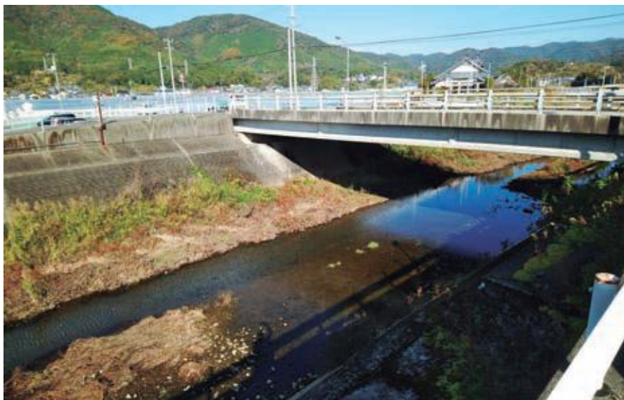
河川監視カメラ設置が望まれる和食川

先頃、四国地方整備局から簡易型河川監視カメラの設置希望調査があり、和食川河口付近と長谷川大谷口橋付近の2カ所が採択待ちで、不採択時は河川管理者の県に要