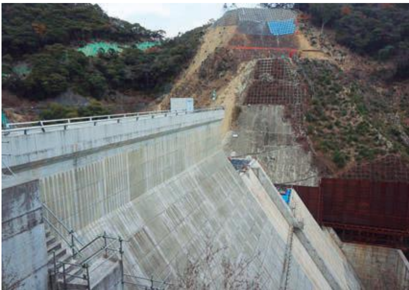
海の望めるダムへ

転入者の内訳は、外国からは農業技能実習生がほとんどで、村外からは、子育てや福祉施策などの充実により、当村の住みよさを実感し転入者が増加したと分析している。