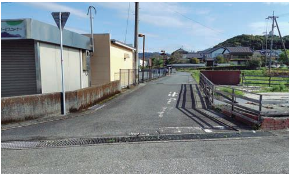
改良予定の村道シルデン線