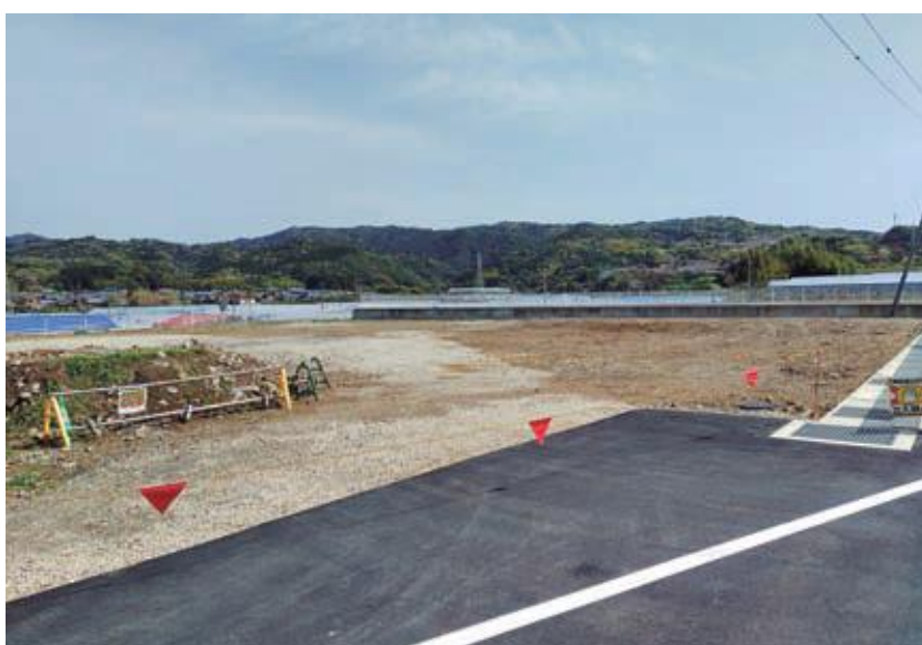
公営住宅建設予定地