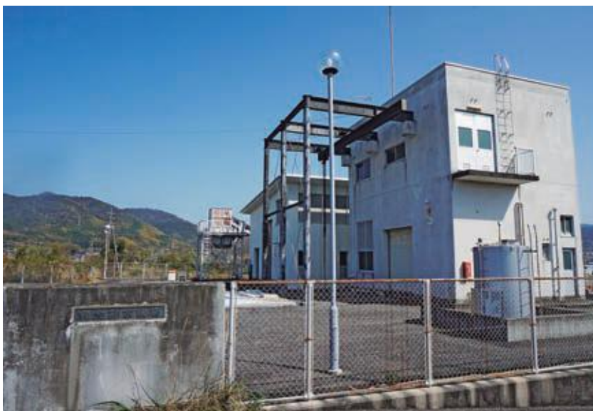
電気設備が更新される和食排水機場