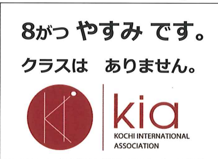
2024 8 August